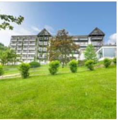
Nexus Klinik Baden-Baden

Übersicht über die Kliniken der Celenus-Gruppe (inkl. somatische Kliniken):