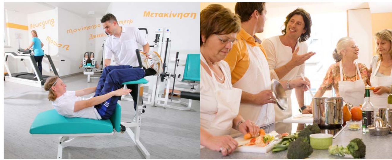
Celenus Teufelsbad Fachklinik