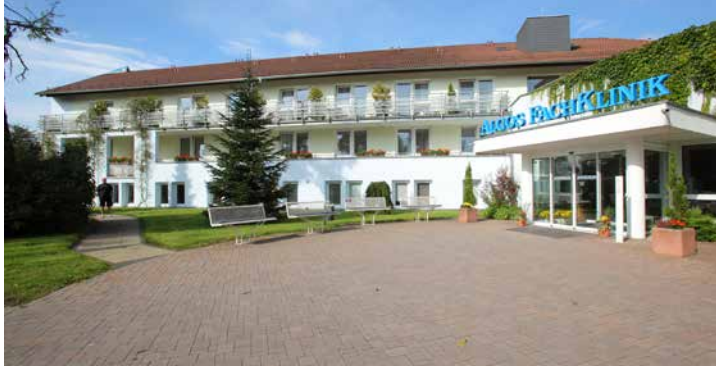
Celenus Algos Fachklinik