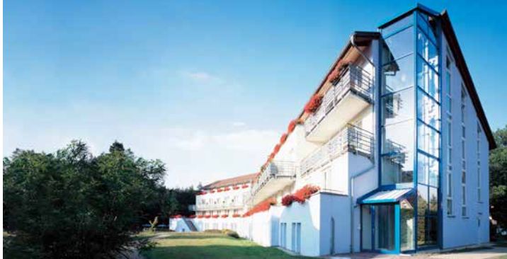
Celenus Algos Fachklinik