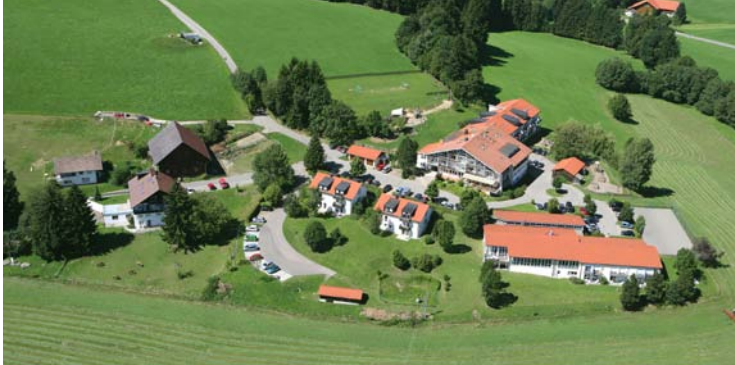
Celenus Klinik Bromerhof