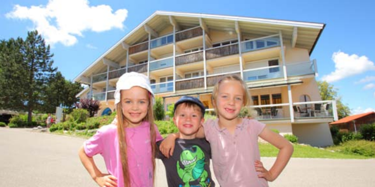
Die Celenus Fachklinik Bromerhof