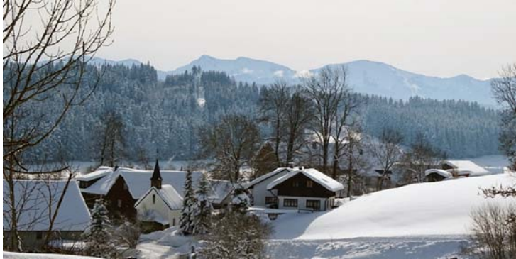
Erholsame Landschaft im Allgäu