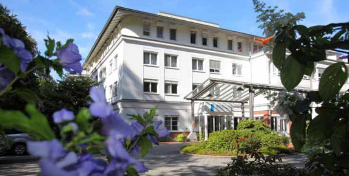
Die Celenus Fachklinik Freiburg