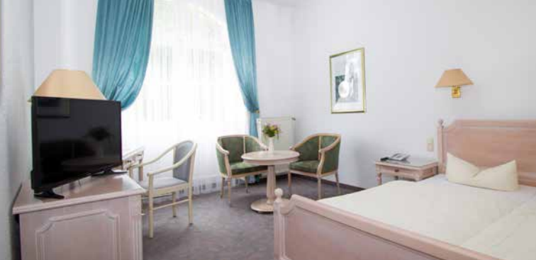
Beispielzimmer in unserem Altbau