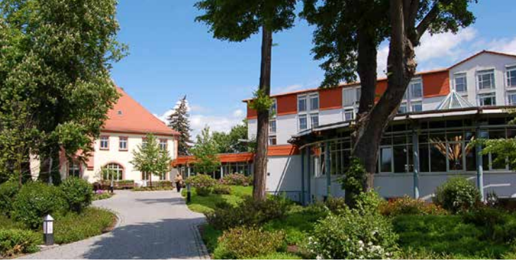
Die Celenus Klinik an der Salza